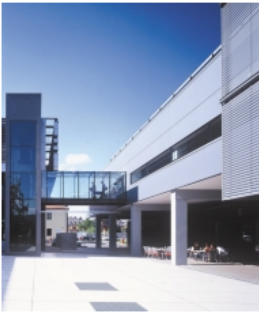
Wifi Technikzentrum, Klagenfurt