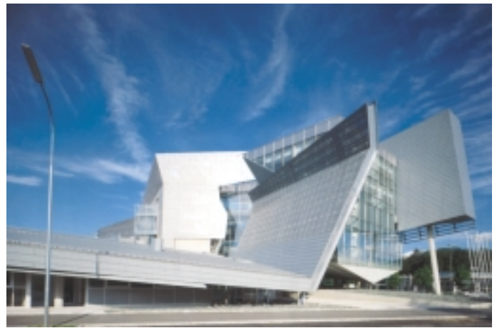
Thom Mayne: Hypo Alpe-Adria-Zentrum, Klagenfurt